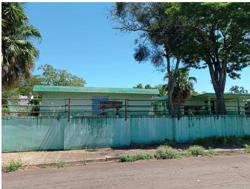
Vista do imóvel o qual faz frente para a rua Benjamin Welter

Em atenção a solicitação do Perito Leiloeiro na seq. 138 , dos autos acima identificado, em tramite junto a Vara da Fazenda Pública, desta comarca, procedi vistoria no imóvel descrito na seq. 58.1 , para fins de estabelecer o valor de mercado, na forma que segue: :